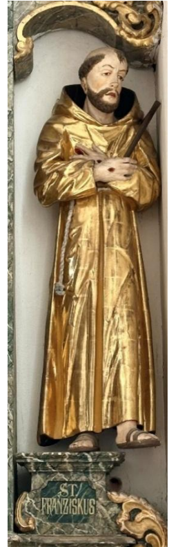
Franziskus am rechten Seitenaltar der Sankt Heinricher Kirche

Die Karwoche erzählt von der Liebe, die den heiligen Franziskus erfüllt hat. Einer Liebe, die sich verschenkt und hingibt bis ans Kreuz. Einer Liebe, die trägt, durch die Wunden und Verletzungen des Lebens, und die gerade darin neues Leben schenkt.